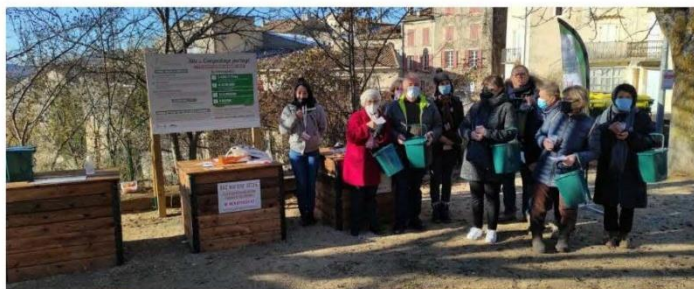
Les représentants de la mairie et les premiers saltésiens présent lors de l'inauguration.

Hélène KROWARSCH - 29 sept. 2022 à 19:39 - Temps de lecture : 2 min