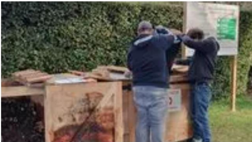
Le compostage partagé - Le cercle des poubelles partagées

Entre décembre 2021 et septembre 2022, ce sont 7 sites de compostage partagé qui ont été installés dans les villages de Mormoiron, Méthamis, Villes-sur-Auzon, Saint Christol d'Albion, Malemort-du-Comtat et un double site à Sault qui compte à présent 7 bacs. Au total, ce sont 138 foyers mobilisés.