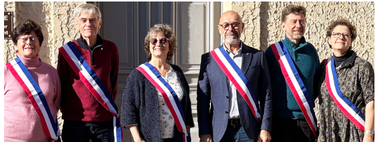
Le maire et ses adjoints

Celui du 7 décembre : l'attribution des délégations ; les désignations des délégués aux différents syndicats ; l'organisation du CCAS et plusieurs décisions sur l'urbanisme.